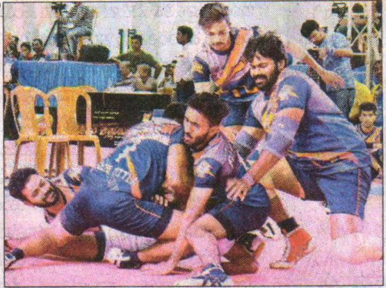
ಮಂಗಳೂರಿನಲ್ಲಿ ನಡೆದ ಸೆಲೆಬ್ರಿಟಿ ಕಬಡ್ಡಿ ಲೀಗ್ ಟೂರ್ನಿ.