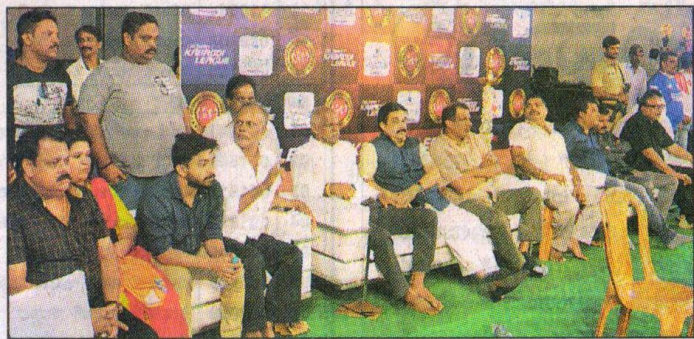
ಉದ್ಘಾಟನೆ ಸಮಾರಂಭದಲ್ಲಿ ಪಾಲ್ಗೊಂಡ ಗಣ್ಯರು.